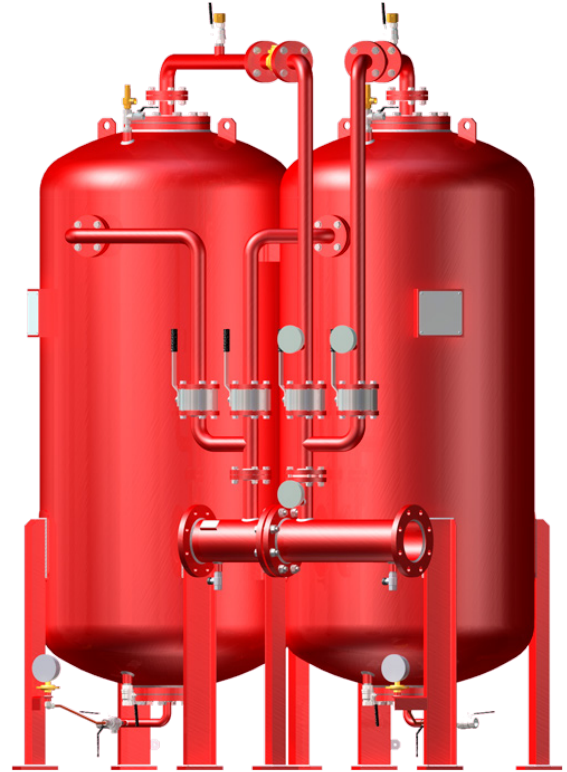
La foto corresponde a un depósito doble de membrana modelo SE-MXC-I-2X The photo is referred at twin type version model SE-MXC-I-2X